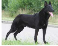
BRN 19479 | Sita (Dhr. H.J. Dikken, Zwartsluis)

PH I 416 CL (ZT, Pesse, 04-10-2008) PH II 453 CL (Haaksbergen, 07-2009)