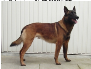
Guido van Valesca's Home (Dhr. J.I.G. Tempelaars, Ossendrecht, NHSB 2710756)

HD-A (Norbergwaarde 38, Botafw. 0), ED-0Geb.datum: 14-04-2013NHSB 2920532