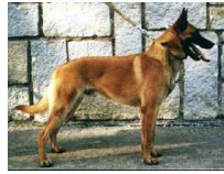
Cora ze Svobodného dvora (NHSB 2375315)

HD AGeb.datum: 30-04-2000"IMP"(CS.) CMKU/BOM/1578/00NHSB 2375315