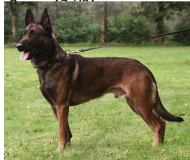
Uzi (Dhr. J. Esther, Payson, AZ, USA, NHSB 2659736)

Geb.datum: 24-11-2011HD-A (Norbergwaarde 38), ED-0NHSB 2861849