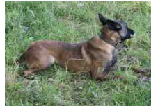
Robbie (Dhr. P.J.M. Smulders, Heeze, NHSB 2395354)

HD AGeb.datum: 30-04-2000"IMP"(CS.) CMKU/BOM/1578/00NHSB 2375315