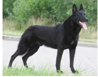
BRN 19479 | Sita (Dhr. H.J. Dikken, Zwartsluis)

PH I 416 CL (ZT, Pesse, 04-10-2008) PH II 453 CL (Haaksbergen, 07-2009)