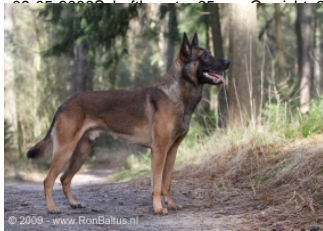
Explosive-Eli van de Vroomshoeve (Dhr. J. (Jeroen) Vunderink, Maarn, Netherlands, NHSB 2608523)

PH I 421 CL (Zeist, 07-05-2016, 60-18-328-8-7)HD A (Norbergwaarde 30, Botafw. 0), ED 0, Rug 100% (op 3 jaar oud), Oogziekten-vrij, SDCA1-normalDNA Profiel 526691 (ISAG2006)Geb.datum: 09-12-2011Schofthoogte: 65 cm, Gewicht: 34 kgChip: 528140000476357NHSB 2865126