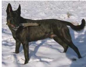
BRN 11966 | Rommel's Lotte (Dhr. H. Niemann, Magdeburg, BRD)

VPG III, AD. HD/ED vrij Geb.datum: 28-02-2006