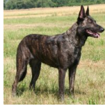
BRN 6524 | Nelson (Dhr. T. Schmidt, Waldheim, BRD)

Polizeihund in Sachsen, Duitsland Geb.datum: 19-03-2002