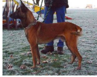
BRN 13850 | Rommel's Elli (Dhr. H. Thiele, Gehringdorf, BRD)

Sch.Hund III, Körung II Geb.datum: 16-11-1995 († APR-2009)