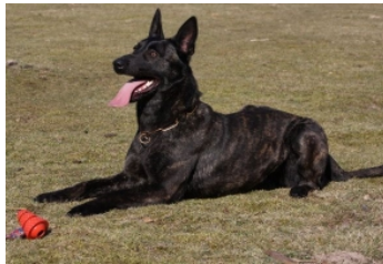
BRN 16639 | Rommel's Lila (Dhr. M. Gradi, Kelheim, BRD)

In opleiding Diensthund, BH, AD. HD-B/ED 0 Geb.datum: 06-09-2009