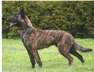
BRN 16219 | Rommel's LingLing (Dhr. S. Schönherr, Mansfeld, BRD)

In opleiding Diensthund, BH, AD. HD-B/ED 0 Geb.datum: 06-09-2009