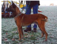
BRN 13850 | Rommel's Elli (Dhr. H. Thiele, Gehringdorf, BRD)

Sch.Hund III, Körung II Geb.datum: 16-11-1995 († APR-2009)