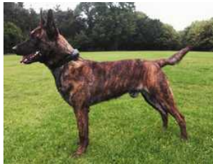
BRN 16086 | Boris (Dhr. A.L.M. Doezé, Eindhoven)