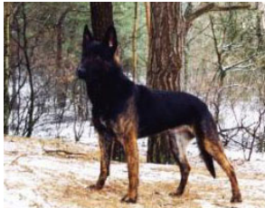
BRN 12127 | Stella (Dhr. Penninx, Mortel)

PH I 400 CL (2014) Obj. 380 CL (2014) KNPV toetsing Geb.datum: 08-07-2006 († 26-03-2019)