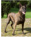
BRN 6524 | Nelson (Dhr. T. Schmidt, Waldheim, BRD)

Polizeihund SEK Sachsen, BRD Geb.datum: 19-03-2002