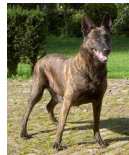
BRN 6524 | Nelson (Dhr. T. Schmidt, Waldheim, BRD)

Polizeihund SEK Sachsen, BRD Geb.datum: 19-03-2002