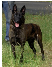
BRN 10578 | Donna (Dhr. G. van Hoek, Moergestel)

PH I 424 CL (Ommen, 05-05-2007, Dhr. L. Kikkert, Lettele) Geb.datum: 23-07-2003 Chipnr: 528-210000860840