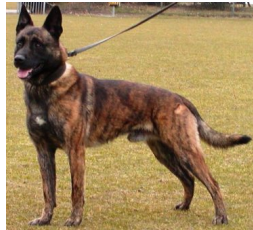
BRN 4618 | Arko (Dhr. M. Suttle, Lewisburg, WV, USA)

PH I 390 C (Nederweert, 25-07-2009) Geb.datum: 04-09-2006