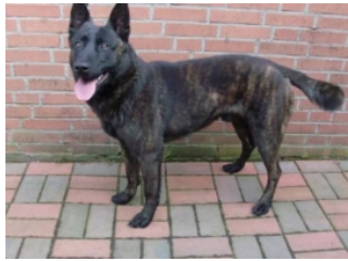
BRN 11228 | Boelie (Mevr. L. Fox-Pozun, Heerlen)

PH I 390 C (Nederweert, 25-07-2009) Geb.datum: 04-09-2006