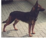
BRN 2306 | Kimba (Dhr. J.H. Wehrens, Vaesrade)

Geb.datum: 21-12-1991 / † 18-02-2005 5 nakomelingen op het NK