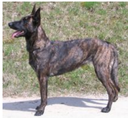
Luna-Tsunami (Mevr. S. Weidinger, Nürnberg, VDH 06/144R0139, Duitsland)

VPG III, IPO III (teilnehmer bayrischen meisterschaft 2009) HD-A, Å ED vrij Geb.datum: 16-05-2005 VDH 06/144R0139 Chipnr:276-096900116496