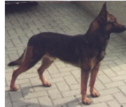
BRN 2306 | Kimba (Dhr. J.H. Wehrens, Vaesrade)

Geb.datum: 21-12-1991 / † 18-02-2005 5 nakomelingen op het NK