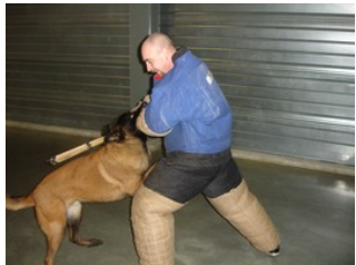
BRN 8631 | Ibor van Theyzenhof (Dhr. E. Serroyen, Lommel, België, NVBK 19165)

16/03/2007 geslaagd in zijn ingangsproeven voor de Politie Belgische ring -mooie volle beet -zeer grote apporteerlust -van niks bang -gaat overal op en over Geb.datum: 16/06/2005 fokker: Kennel Van Theyzenhof Kleur: Rosgevlamd/zwart masker