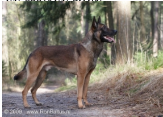
Dany (Dhr. A. van Ede, Woudenberg, NHSB 2700356)

PH I 426 CL (Vezep, 07-05-2010), 63-18-327-10-10) HD A (Norbergwaarde 33, Botafw. 0), LVT-0, ellebogen en Rug 100% (op 7½ jaar oud rug nogmaals gescreend), Oogziekten-vrij, SDCA1