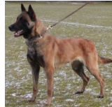
Omar van Fort Oranje (Dhr. J. van de Visch, Nijkerk, NHSB 2199694)

HD-A (Norbergwaarde 40, Botafw. 0) Geb.datum: 17-10-2002