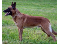
Tyra van de Vroomshoeve (NHSB 2434202)

IPO III HD A Norbergwaarde 35, Botafw. 0