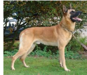
Ezra van Masja's Home (Dhr. L. Beck-Schipper, Ureterp, NHSB 2585550)

PH I 419 CL (2011) PH II 440 CL (Drachten, 30-06-2012)