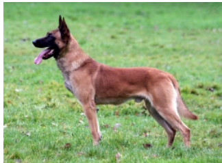
Big-Benton van Roosfaya (Dhr. J. Vunderink, Maarn, NHSB 2865126)

PH I 421 CL (Zeist, 07-05-2016) PH II 431 CL (Baarn, 29-09-2018) Obj. 402 CL (Leusden, 01-06-2019) HD A (Norbergwaarde 30, Botafw. 0), ED-0, LVT-0, Rug 100% (op 3 jaar oud, op 6,5 en nogmaals op 9,5 jaar oud), Oogziekten-vrij, SDCA1 N/N, SDCA2 N/N, DM N/N, CJM N/N, Dilute-D/D DNA Profiel 526691 (ISAG2006) Geb.datum: 09-12-2011 († 21-03-2025) Schofthoogte: 65 cm, Gewicht: 34 kg Chip: 528140000476357 NHSB 2865126