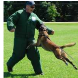
BRN 19758 | Sasja (Dhr. R. Gnodde, Frankford WV, USA)

Sch.Hund I, PSA I PSD - Narcotics Detection