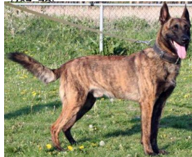
BRN 12297 | Indy (Dhr. P. de Laat, Valkenswaard)

PH I 431 (Almere, 24-05-2008) Cert.Beveiligingssurveillancehond Geb.datum: 16-05-2005: heupen, rug en ellebogen 9e Nationale wedstrijd 10 aug. 2008 Venlo