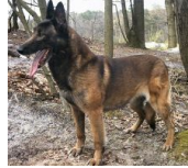
BRN 10687 | Simba (Dhr. J. Boons, Vlijmen)

PH I 401 C (10-10-2003) Geb.datum: 1997 († jan-2010)