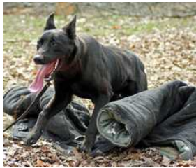
BRN 17754 | Jux (Mevr. M. Bays, Hurricane WV, USA)