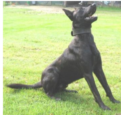
Shadow van 't Struweel (Dhr. M. Borkus, Hengelo GLD, NHSB 2515615)

PH I 404 CL Geb.datum: 27-06-2004 NHSB 2515615 6e Nat.Stamboomhondenwedstrijd te Wezep 2007 (375, ZW)