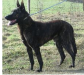
Caya Olga van de Vastenow (NHSB 2281903)