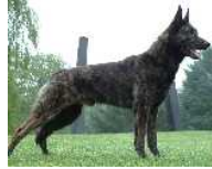
BRN 7658 | Pasja (Dhr. W. Beldman, Dalfsen)