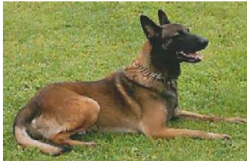
Kukay's Xjack (Dhr. A. van Essen, NHSB 2325619)

PH I 430 CL (Bergschenhoek, 18-07-2009, Mevr. E. Vreeken, Moerkapelle) Geb.datum: 14-11-2006 3e Jonge Honden Competitie 2009 Afd. Zuid-Holland (Nico Ram Memorial)