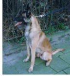
Kukay's Ratje (LOSH 0723147)