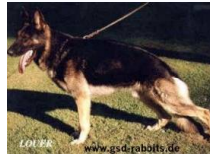
Ursel 't Palmaleinehof (LOSH 0786578)