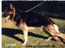
Ursel 't Palmaleinehof (LOSH 0786578)

IPO III, Sch.Hund III HD B Geb.datum: 15-02-1998