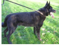
Aschja von der Blitse Düne (NHSB 2184125)

NHSB 2311150 Zeer temperamentvol en sociaal, uitstekende apporteerder. Vererft zijn kwaliteiten erg goed. von d