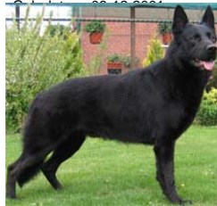
Brieta 't Linnershof (Dhr. R. Gabriëls, Essen, België, LOSH 0902641)