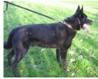
Aschja von der Blitse Düne (NHSB 2184125)