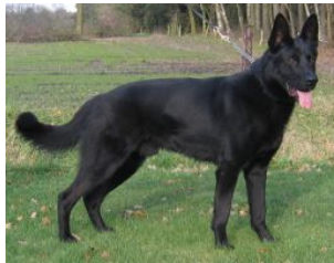
Carlos (Dhr. P.J.M. Hellemons, Hoeve, NHSB 2529018)

PH I 428 CL HD B Notbergw. 33 Geb.datum: 24-11-2003 NHSB 2529018