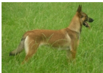
Illuna (Mvr. L. Gilgemijn, Gullegem, België)