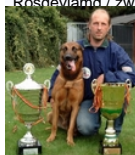
F'Amber (Dhr. Vander Voorde, Schepdaal, België, NVBK br. 1852)

Nat. Kamp. van België cat. 2 Geb.datum: 1/03/1999 Rosgevlamd / zwart masker Moernout Moernout