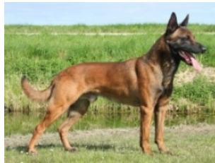
BRN 19350 | Rednies Shelby GT (Mevr. S. van Zuijlekom, Huissen)

PH I 436 CL (25-05-2013) Obj. 406 (27-07-2013) PH II 443 CL BSH 272 CL (29-09-2019)