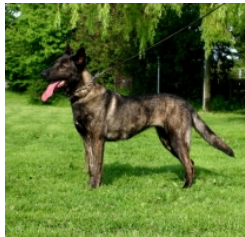
BRN 15802 | Rommel's Erna (Dhr. A. Stude, Eisleben, BRD)