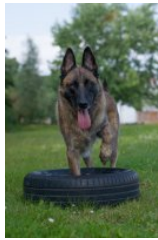
BRN 14484 | Doerak (Mevr. E.E.C. Kampert, Groningen)

Huishond Geb.datum: 05-12-2010 (+ 03-01-2022) Schofthoogte: 67 cm