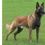
BRN 20484 | Meta (Dhr. M. Bloemert, Staphorst)

PH I 430 CL (juli 2006) Obj. 355 CL (03-05-2007, Ommen)