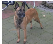
BRN 8744 | Ybbor (Dhr. R. Meijer, Zwartsluis)

PH I 430 CL (juli 2006) Obj. 355 CL (03-05-2007, Ommen)